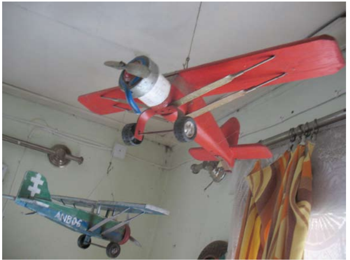
Kambarį puošia vos ne skraidantys „Lituanicos“ ir lietuviškų orlaivių „Anbo“ bei „Dobi“ modeliai.