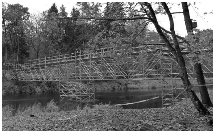
Šios konstrukcijos yra tik tilto statybai reikalingi pastoliai, kurie bus nurodinti baigus darbus.

kur vesiantis „beždžionių“ tiltas pagal planus bus kairiojo ir dešiniojo Šventosios krantų dviračių ir pėsčiųjų takų dalimi. O tokiai